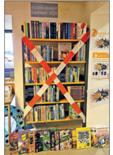
Buchsommer-Eröffnung war am 22.06.2026