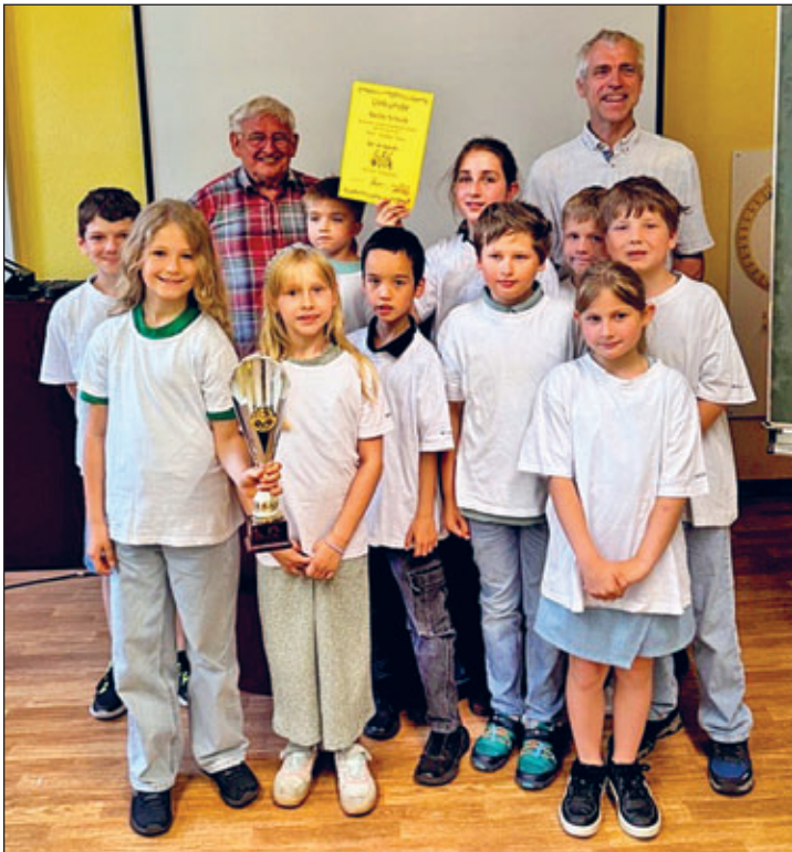
Team Kitzscher beim Vergleichswettkampf in Rötha

Der Wettkampf baut auf das Ganztagsangebot Schach auf, das in den Schulen zuverlässig angeboten wird. Ziel des Unterrichts ist es, den Kindern das Grundwissen über das königliche Spiel der 64 Felder zu vermitteln. Sie in die Lage zu versetzen, selbstständig eine korrekte Schachpartie bis zum Matt zu spielen. Es ist eine große Bestätigung für das GTA-Angebot, mit welcher Freude und Fähigkeiten die Teilnehmer sich diesem anstrengenden Wettkampf stellen und um das beste Ergebnis ringen: es gilt sechs Partien à sieben Minuten Bedenkzeit zu bewältigen.