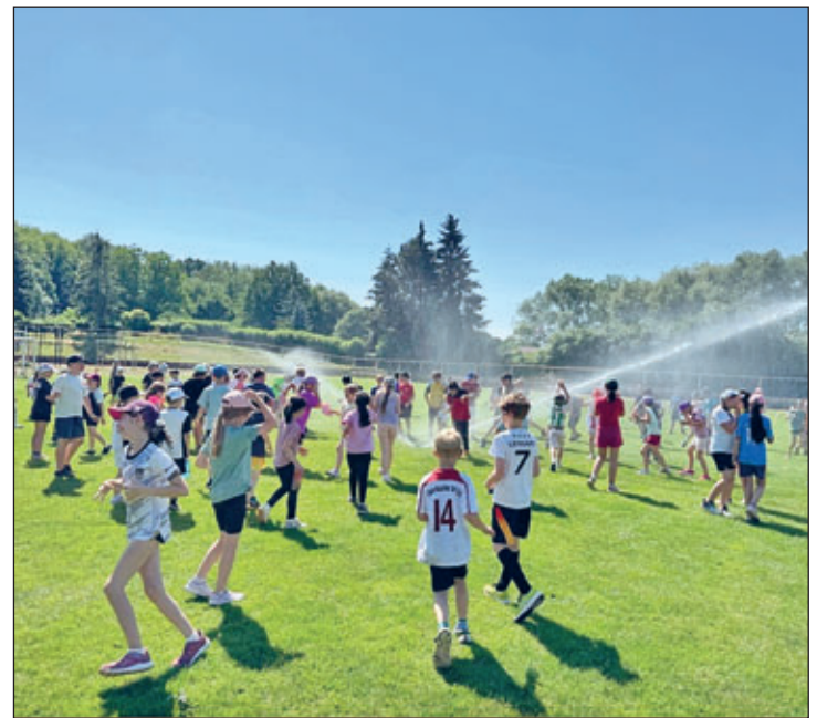
Abkühlung zum Sportfest der Grundschule

In dieser Zeitspanne beschäftigten sich die Lehrkräfte sowie Kinder auf vielfältige Weise mit dem Thema Fußball-Weltmeisterschaft. Eine besondere Erfahrung war dabei der Besuch der Blindenfußballer vom 1. FC Lokomotive Leipzig. Die Schülerinnen und Schüler erhielten spannende Einblicke in diese beeindruckende Sportart und konnten selbst erleben, wie Fußball ohne Augenlicht gespielt wird. An dieser Stelle bedanken wir uns recht herzlich für diese grandiose Möglichkeit! Den Abschluss der Projektwoche bildete das Sportfest am Freitag, den 19. Juni 2026. Trotz der hohen Temperaturen waren die Kinder mit großer Begeisterung dabei und hatten viel Freude an den verschiedenen Stationen. Für eine gelungene Abkühlung war ebenfalls gesorgt, sodass alle einen großartigen Tag erleben konnten.