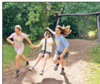
Teilnehmerinnen während des Sommercamps im Jahr 2025

Das Sommercamp bietet Kindern die Möglichkeit, neue Freundschaften zu knüpfen, spannende Erfahrungen zu sammeln und die Sommerferien aktiv und kreativ zu gestalten. Die Kosten für die Teilnahme belaufen sich auf 150 Euro. Die Anmeldung ist über drkll.de/sommercamp möglich. Das Sommercamp wird im Rahmen des Entwicklungsprogramms für den ländlichen Raum im Freistaat Sachsen (EPLR) 2023–2027 durch den Freistaat Sachsen und die Europäische Union kofinanziert.