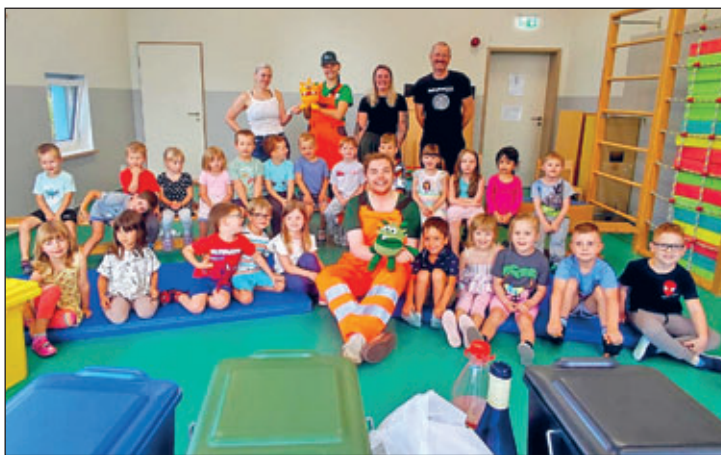
Gruppenbild mit den Mitgliedern vom Mülltheater

Zum Abschluss konnten die Kinder ihr Wissen unter Beweis stellen. Mit viel Eifer ordneten sie verschiedene Abfälle den richtigen Mülltonnen zu und zeigten, dass sie schon richtige Müllexperten sind. Das Mülltheater war ein voller Erfolg und bereitete allen großen Spaß. Spielerisch wurde den Kindern ein wichtiger Beitrag zum Umwelt- und Klimaschutz vermittelt.