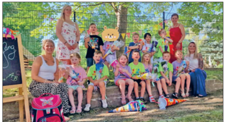
Schulanfänger der Kita Kunterbunt 2026

Besonders emotional wurde es beim traditionellen „Rauswurf“ der Vorschulkinder. Unter dem gemeinsamen Spruch: „1, 2, 3, die Kita-Zeit ist jetzt vorbei!“, wurden die Kinder symbolisch aus der Kita verabschiedet. Ein bewegendes Moment der allen zeigt, dass nun ein neuer Lebensabschnitt beginnt. Aus Kindergartenkindern werden Schulkinder – bereit für neue Abenteuer, Herausforderungen und Erfahrungen.