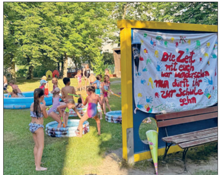
Mit viel Wasser, guter Laune sowie einem Picknick im Schatten sowie leckerem Eis, war der Tag gerettet.