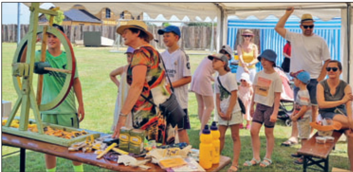
Heiße Glücksspiele am Nachmittag in Hainichen

Trotz großer Hitze fand am Wochenende vom 26.06.2026 bis 27.06.2026 in gewohnter Form unser Vereinsfest in Hainichen statt. Witterungsbedingt wurden nicht nur die Rasensprenger im stetigen Betrieb gehalten, sondern sogar noch ein Pool aufgebaut – dies freute nicht nur die kleinen Kinder, auch die "Größeren" fanden sich immer wieder zu einer Erfrischung ein. Am Samstag bei ca. 40°C konnte damit gut Abkühlung geschaffen werden.