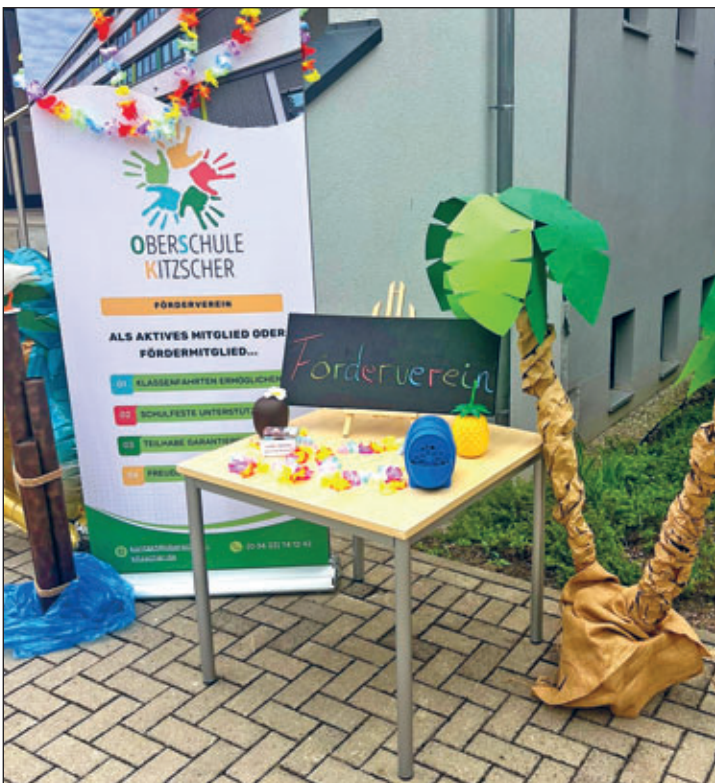
Förderverein der OSK ludt zum Sommerfest

Dann ging es richtig los: Die Besucher konnten sich durch ein wahres Schlemmerparadies probieren. Exotische Sandwiches mit Ananas-Chutney, erfrischende Sommercocktails und eine Vitaminbar mit Gemüse- und Obstvariationen sorgten für Urlaubsstimmung. Wer es lieber süß mochte, steuerte direkt den Waffelstand oder die beliebte Naschbude mit gebackenen Köstlichkeiten und süßen kleinen Tüten an.