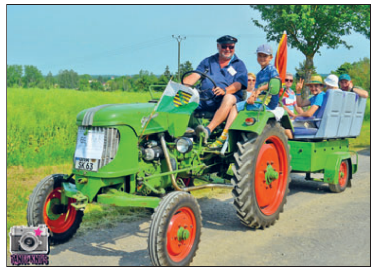
Viele besondere Oldtimer waren beim Schleppertreffen in Wyhra zu bewundern und zeigt die große Leidenschaft der Besitzer

Der Verein zur Erhaltung der kulturellen Vielfalt e.V. blickt auf ein rundum gelungenes 22. Pfingstschleppertreffen in Wyhra zurück. Über das Pfingstwochenende zog die Veranstaltung zahlreiche Besucher, Traktorenfreunde und Familien aus der Region und darüber hinaus an. Bei bestem Festwetter präsentierten die Teilnehmer ihre liebevoll restaurierten historischen Schlepper und Landmaschinen. Neben den beeindruckenden Fahrzeugen sorgte ein abwechslungsreiches Bühnen- und Musikprogramm für beste Unterhaltung. Besonders die gemeinsame Leidenschaft für die Landtechnik, viele interessante Gespräche und das gesellige Miteinander machten die Veranstaltung zu einem besonderen Erlebnis.