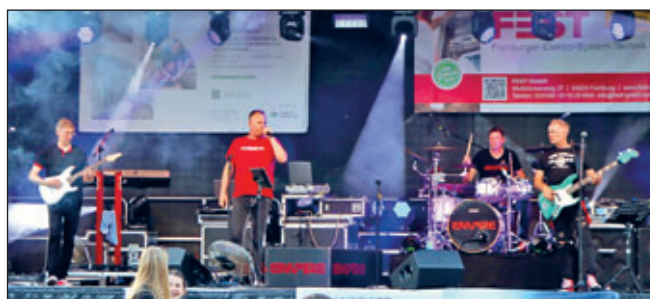
Empire – Die Band aus Zerbst in Sachsen-Anhalt spielten am Abend auf der großen Festbühne

Park- und Teichfest am letzten Mai-Wochenende – ein unterhaltendes und familienfreundliches Jahreshighlight mit zahlreichen Aktivitäten für Klein und Groß, einem tollen Bühnenprogramm sowie leckeren Köstlichkeiten allerorten. Lesen Sie den Bericht zum Fest in den „Sonstigen Mitteilungen“ dieser Amts- und Informationsblattausgabe. Ebenso finden Sie den Bericht mit weiteren Impressionen auf unserer Internetseite unter https://kitzscher.de .