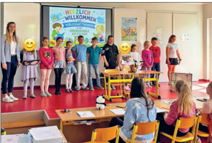
Großen Mut bewiesen die Teilnehmerinnen und Teilnehmer des Leselöwenwettbewerb in der Aula der Grundschule

Für die Erstklässler war dieser Wettbewerb eine ganz besondere Erfahrung: Bei ihrem ersten großen Leseauftritt standen sie zwar schon mutig vor Publikum, wurden jedoch noch nicht bewertet. So konnten sie ohne Druck ihr Lesedebüt genießen und erste Wettbewerbsluft schnuppern. Alle teilnehmenden Kinder präsentierten zunächst ihr Lieblingsbuch und gaben den Zuhörerinnen und Zuhörern einen kurzen Einblick in die Geschichten. Anschließend lasen sie eine vorbereitete Textstelle daraus vor. Im zweiten Teil des Wettbewerbs wurde es dann noch einmal spannend: Die Kinder mussten einen ungeübten Text vorlesen. Hier zeigte sich besonders, wie gut sie auch unbekannte Inhalte flüssig und betont lesen können.