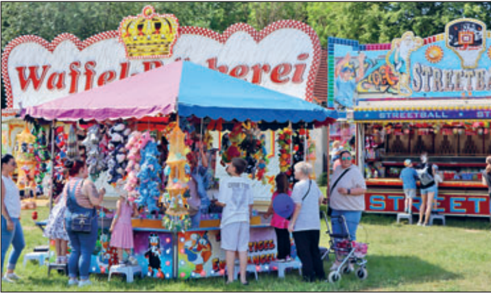
Rummelambiente auf dem Festplatz

Punkt 14:00 Uhr am Samstag startete der zweite Tag. Die letzten Enten wurden auf dem Festplatz verkauft. Dass die Enten sich nach wie vor größter Beliebtheit erfreuen und sozusagen eines der absoluten Highlights des ganzen Wochenendes darstellen, ist den meisten Gästen bewusst. Demzufolge wurde die letzte der bis dato noch übrigen 250 Enten am Samstag bereits nach 30 min. verkauft. Neben dem Entenverkauf fand die große Schätzaufgabe des vollen Einkaufswagens dieses Jahr erneut ihren Platz. Für je 0,50 EUR konnte man beliebig viele Schätzungen abgeben, um sich später vielleicht sogar an dem vollen Einkaufswagen zu erfreuen. Das Programm auf der großen Festbühne eröffnete die Kita Wirbelwind. Musikalisch stimmten sie das Publikum ein, welches sich zahlreich auf dem Festplatz versammelt hatte. Alle Anwesenden sangen plötzlich mit und alle hatten „oben gute Laune, unten gute Laune...“. Im Anschluss stürmten die Kinder der Kita Kunterbunt die Plattform und führten einen kunterbunten Auftritt auf. Die Fans klatschten begeistert von vorderster Front. Bürgermeister Maik Schramm dankte dem Erziehern Xaver Apfelbeck und Claudia Illgen.