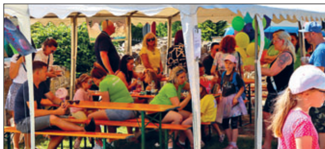
Kinderfest in den Mauern der alten Stallungen im ehemaligen Rittergut