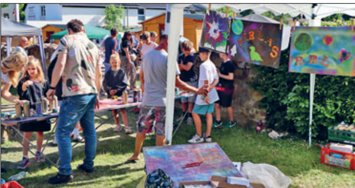
Graffitibilder beim Kinder- und Jugendtreff.

In den Pausen war Zeit um inne zu halten, einen Plausch zu führen, die kulinarischen Angebote vom Frauenchor, Heimatverein, den Kraftsportlern, vom FSV Kitzscher und der Feuerwehr zu genießen oder auch das Kinderfest innerhalb der historischen Stallmauern oder den Rummel zu besuchen. Die Kameraden der Freiwilligen Feuerwehr bauten im Hintergrund während der Kaffeezeit das Zelt für den Gyrosverkauf auf. Nun war der Festplatz endgültig bereit. Immer mehr Gäste kamen durch den Park auf das Festgelände geströmt. Das Kinderfest lief neben dem Bühnenprogramm und wurde vom Offenen Kinder- und Jugendtreff, dem Heimatverein sowie den Kindereinrichtungen der Stadt organisiert. Eine Vielzahl von Vereinsmitgliedern, Erzieherinnen und Erzieher betreuten die verschiedenen Stände und ließen damit die Chance, Freunde und Bekannte zu treffen und lockere Gespräche zu führen.