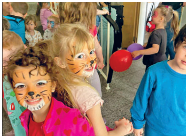
Kinderschminken, Luftballons, PawPatrol und Kinderdisco – es fehlte an nichts beim Kindertag im Wirbelwind

Endlich, Kindertag. Am 01.06.2026 stieg die große Kindertagsparty in der Kita der Wirbelwinde. Neben Kinderschminken, einer Bastelstraße und einem Glücksrad kamen zwei Überraschungsgäste zu Besuch. Als Sky & Chase von der PAW Patrol in die Kita kamen, waren die Kids kaum noch zu halten. Im Anschluss, bei der großen Kinderdisco, konnten alle Kinder zeigen, wie toll sie tanzen und sich bewegen können.