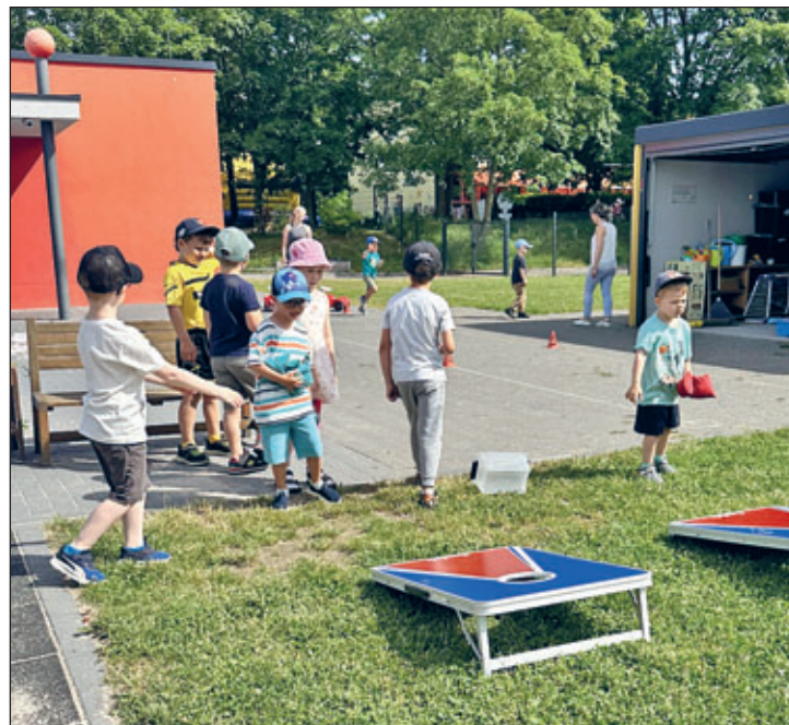
Säckchen werfen stand hoch im Kurs – schnell war da der Ehrgeiz gepackt

Für die Erzieherinnen der Einrichtung war es eine große Freude, den Kindern diesen besonderen Tag zu gestalten. Zum Mittagessen wurde gemeinsam gegrillt. Als süße Überraschung durfte natürlich auch ein leckeres Kaktuseis als Nachtisch nicht fehlen.