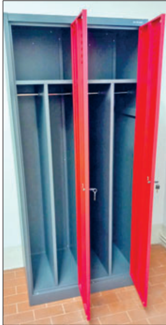
Das neue Spindmodell für die Mitglieder der Jugendfeuerwehr

Für die Jugendarbeit werden insgesamt 20 dieser Einzelspinde benötigt. Sie ermöglichen eine klare Trennung von Straßen- und Dienstkleidung und können aufgrund ihrer Bauweise problemlos getrennt für Jungen und Mädchen aufgestellt werden. Damit leisten sie einen wichtigen Beitrag zur Ordnung, Hygiene und Struktur im Alltag der jungen Feuerwehrmitglieder.