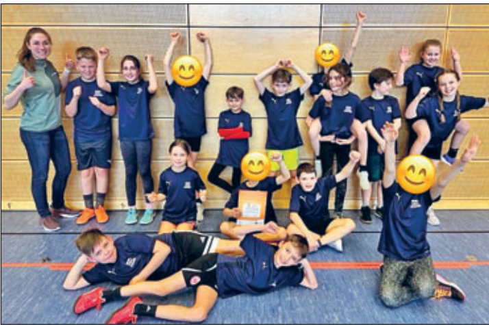
Stolze Silber-Gewinner aus Kitzscher beim Zweifelderballturnier in Borna

Schon zu Beginn war die Aufregung bei allen Kindern deutlich spürbar. Die Konkurrenz war stark und versprach spannende Begegnungen. Nach der Auslosung der Spielkonstellationen stand fest: Es wurde im Modus „Jeder gegen jeden“ gespielt – eine echte Herausforderung für die jungen Sportlerinnen und Sportler.