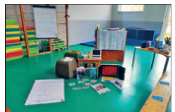
Der Sportraum wurde für das Eltern-Café mit dem Thema Medienbildung vorbereitet

Im Mittelpunkt stand die Frage, wie Kinder im Alter von 3- 6 Jahren sinnvoll mit digitalen Medien umgehen können. Dabei wurde deutlich, dass Medien heute zum Alltag gehören, Kinder jedoch eine bewusste Begleitung durch Erwachsene benötigen. Besonders der Austausch unter den Eltern wurde als bereichernd empfunden, da Erfahrungen, Unsicherheiten und Regeln aus dem Familienalltag geteilt wurden.