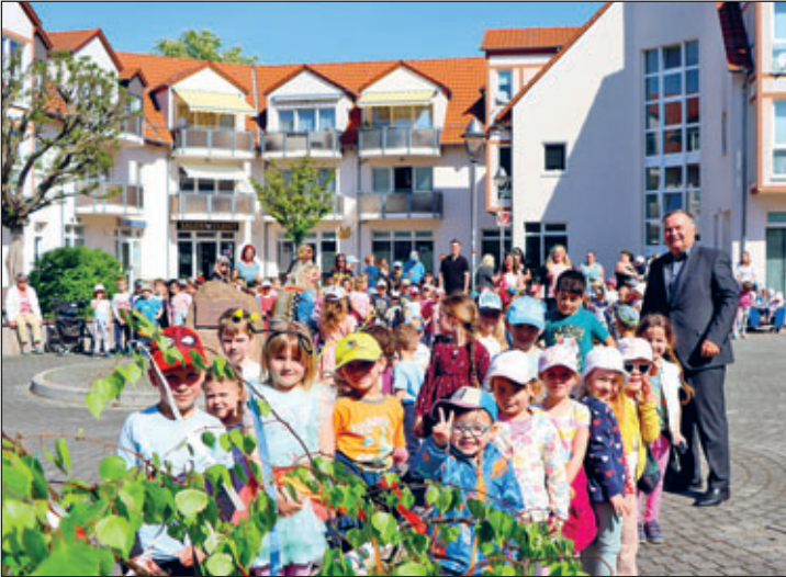
Maibaum aufgestellt – hier und wie immer mit fleißigen Helfern

Kinder, Eltern, Großeltern, Seniorinnen und Senioren bitte ich zahlreich zu erscheinen, um dann gemeinsam mit mir und der Unterstützung der Mitarbeiter unseres Bauhofes den Maibaum aufzustellen. Eine kleine Leckerei zur Stärkung danach sei den Kleinen natürlich versprochen.