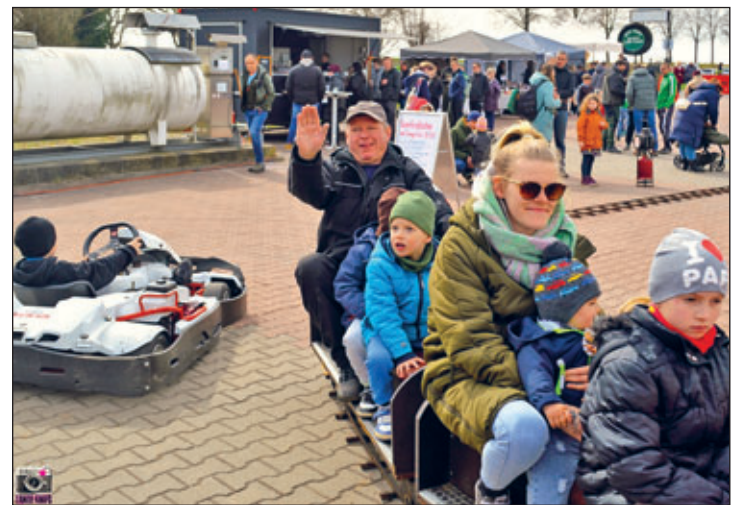
Viel Abwechslung und Informatives beim Hoffest