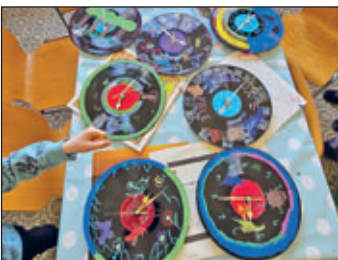
Schallplattenuhr wurden in den Osterferien im Treff gebastelt

Die Osterferien im Offenen Kinder- und Jugendtreff Kitzscher waren kunterbunt und voller schöner Erlebnisse. Insgesamt 30 Kinder und Jugendliche besuchten den Treff und erlebten gemeinsam eine fröhliche Ferienzeit. Beim Hasenbacken, beim Basteln einer Schallplattenuhr sowie beim Fußball- und Dartturnier war jede Menge Spaß und gute Laune garantiert. Gemeinsam wurde gelacht, ausprobiert und eine schöne Ferienzeit verbracht.