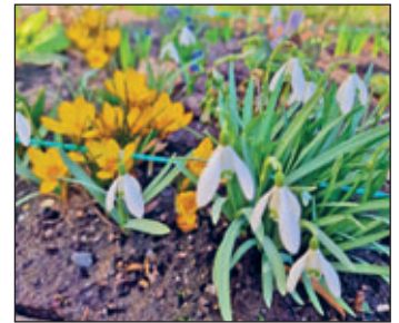
Frühblüher auf dem Weg zum Park

und zeigte auf eine zarte Blume, die sich mutig durch die Erde geschoben hatte. Gemeinsam betrachteten die Kinder die verschiedenen Frühblüher, fühlten vorsichtig an den Blättern und sprachen darüber, welche Farben sie sehen. Besonders spannend ist es für die Kinder zu lernen, dass manche Blumen schon wachsen, obwohl es draußen noch kühl ist. Julia erklärt, dass viele Frühblüher ihre Kraft in einer Zwiebel oder Knolle gespeichert haben. So können sie im Frühling schnell wachsen, sobald die Sonne wieder stärker scheint.