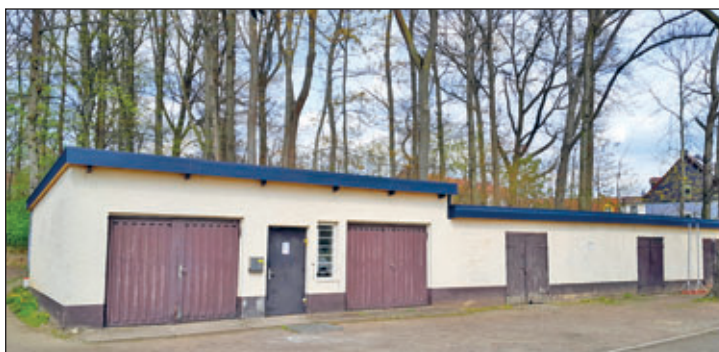
Garagen am Sportlerheims in Kitzscher

Der Lauf der Jahreszeiten hatte dem Dach der Garagen im Johannes-Oberscheven-Sportparks in den vergangenen Jahrzehnten arg zugesetzt. Die äußeren Einflüsse machten eine Sanierung notwendig. Über das Programm LEADER/2023 wurden Fördermittel beantragt. Diesem Antrag wurde umfangreich durch das Landratsamt des Landkreises – Sachgebiet Ländliche Neuordnung entsprochen.