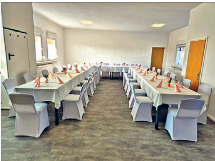
Ein Blick ins sanierte Vereinsheim

Die Räume stehen auch für Nichtvereinsmitglieder zur Verfügung und können gern jederzeit für Feste und Feiern gebucht werden. Buchenden steht eine voll eingerichtete Küche mit Geschirr, Besteck und Gläsern zur Verfügung. Sollten Sie Interesse an den Räumlichkeiten für eine Feierlichkeit im Vereinsheim haben, melden Sie sich rechtzeitig bei Frau Milde unter 015773638419 (Ps.: Für den Schulanfang 2026 ist die Einrichtung bereits belegt – rechtzeitig buchen bringt Sicherheit.)