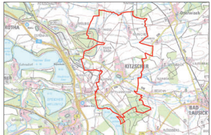
Geltungsbereich der 1. Fortschreibung des Flächennutzungsplans und der Fortschreibung des Landschaftsplans der Stadt Kitzscher