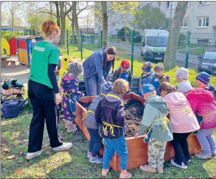
Was für ein Spaß, besonders das Anpflanzen hat allen Kindern ein Lächeln auf die Lippen gezaubert.

Natürlich fieberten die Kinder dem Punkt entgegen, endlich alles mit ihren eigenen Händen einpflanzen, säen und anschließend gießen zu dürfen. Die Freude war riesengroß. Nachdem alles erledigt war freuen sich die Kinder der Eisbären-Gruppe gemeinsam mit ihren Erziehern das Wachstum der Pflanzen zu beobachten und in ein paar Wochen leckeren Kohlrabi, Möhren, Gurken, Radieschen und Salat ernten zu können. Das Team der Kita und die Kinder möchten sich auf diesem Wege ganz herzlich bei der Edeka-Stiftung für diese tolle Aktion bedanken und hoffen auch im nächsten Jahr mitmachen zu dürfen.