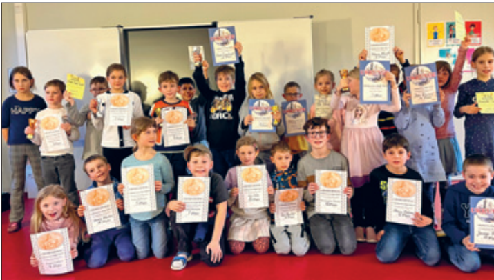
Die Teilnehmer aus allen Klassenstufen vom Schachturnier