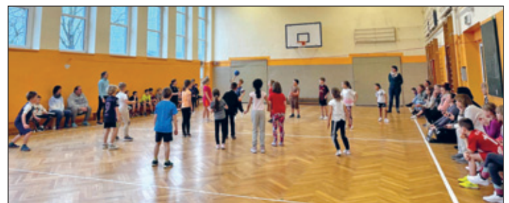
Action in der Grundschulturnhalle beim 2-Felder-Ball

Am 16. Januar 2025 verwandelte sich die Turnhalle der Grundschule Kitzscher wahrlich in eine „Sportarena“. Ausgewählte Kinder der Klassenstufen eins bis vier traten nacheinander gegen ihre Parallelklassen in verschiedenen Ballspielen an. Dabei betätigten sich die Erstklässler bei dem Spiel „Ball-über-die-Leine“ sportlich. Ab Klasse zwei wurde dann das bei den Grundschulern sehr beliebte Spiel „2-Felder-Ball“ gespielt.