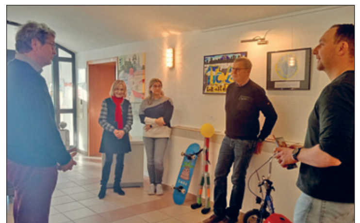
Lockerer Austausch bei der Eröffnung

Den Anfang dabei machte die Oberschule zu ungewöhnlicher Zeit. Der Heimatverein eröffnete die Ausstellung der Prüfungsobjekte der Abschlussklassen am Freitag, den 31.01.2025 um 10:00 Uhr.