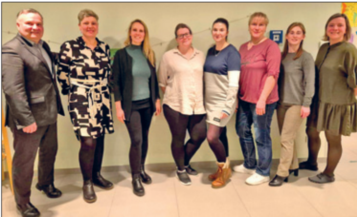
Elternbeirat Kita Kunterbunt 2025