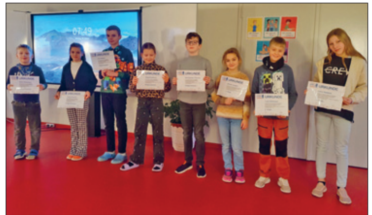
Teilnehmer des Informatikwettbewerbes an der GSK

Die erste Stufe des Wettbewerbs fand am 10.01.2025 in der Aula unserer Schule statt. Zunächst mussten die Kinder einige theoretische Fragen rund ums Thema Computer im Alltag beantworten. Darüber hinaus mussten sie ihre Programmierkenntnisse unter Beweis stellen. Zum Glück wurde das vorher schon im Werken-Unterricht geübt. Im praktischen Teil sollten die Teilnehmenden dann mithilfe von einem Computerprogramm, wie Word oder PowerPoint, ein Buchcover für das Buch "Die magischen Tiere - Die Roboter sind los" gestalten. Diese Herausforderung nahmen alle an und gaben sich große Mühe. Dabei sind tolle Cover entstanden.