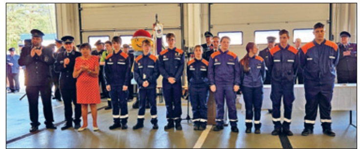
Das Team der Jugendfeuerwehr Kitzscher in der Landesfeuerwehrschule in Nardt

Jedes Jahr findet in der Landesfeuerwehrschule in Nardt eine Ausbildungswoche der Jugendfeuerwehren Sachsens statt. In verschiedenen Disziplinen wie Schnelligkeitsübung, Staffellauf, Kugelstoßen, Wissenstest und Löschangriff wird die Leistungs- und Teamfähigkeit der Teilnehmer im Alter von 15 bis 18 Jahren auf die Probe gestellt. Wenn alle Anforderungen erfüllt sind, ist das Leistungsabzeichen die würdige Belohnung. Eine höhere Auszeichnung für Jugendfeuerwehrmitglieder gibt es nicht. Vom 15.07.2024 bis 20.07.2024 fuhr die Jugendwehr Kitzscher mit sieben Mitgliedern zu dieser Ausbildungswoche. Da jede Gruppe aus neun jungen Feuerwehrleuten bestehen muss, schlossen wir uns mit der Jugendfeuerwehr (JF) Dresden/Cossebaude zusammen und bildeten zwei Mannschaften. In der Addition beide JF waren es dennoch zu wenige Mitglieder, sodass 2 männliche Floriansjünger das doppelte Pensum absolvieren mussten. In den Tests stehen die sportliche Fitness und die Teamfähigkeit im Vordergrund.