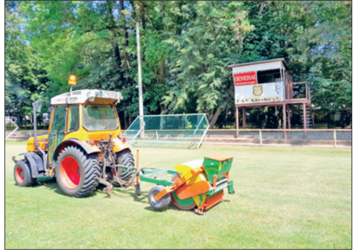
Rasenregeneration - hier auf dem Parksportplatz

sprache mit dem Fachpersonal einer Greenkeeper- Firma wurde direkt nach dem Vertikutieren gesendet und erst im Anschluss die Flächen in Kitzscher aerifiziert. Beim Aerifizieren wird eine Veränderung der Bodenstruktur und damit die weitere Belüftung der Rasentragschicht herbeigeführt. Dabei werden mit dem stadteigenen Perforator durch Hohlspoons kleine Löcher in den Boden gestochen, der vorher aufgetragene Sand in den Boden gebracht und die ausgestochenen Erdstücke, in Fachkreisen auch Cores genannt, durch Abschleppen neu verteilt und damit Ungleichmäßigkeiten in der Fläche ausgeglichen. Nach Fertigstellung der Regenerationsmaßnahme stand die 3. Düngung auf dem Plan.