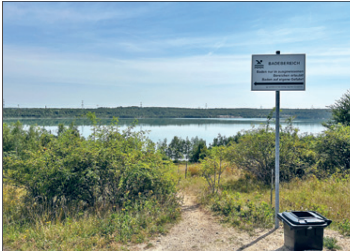
Blick auf den Bockwitzer See

Außerhalb dieses Bereichs sind das Schwimmen und Baden streng verboten, um die Natur und die dort lebenden Arten zu schützen. Insbesondere sind folgende Aktivitäten auf dem gesamten Gewässer untersagt: Segelboote, Ruderboote, Paddelboote, Faltboote, Kanus, Schlauchboote, Tretfahrzeuge, Windsurfen aber vor allem auch Stehpaddelbretter (SUP/Stand-up-Paddeling). Diese Einschränkungen dienen dazu, die empfindlichen Lebensräume der Tiere und Pflanzen im Naturschutzgebiet zu schützen.