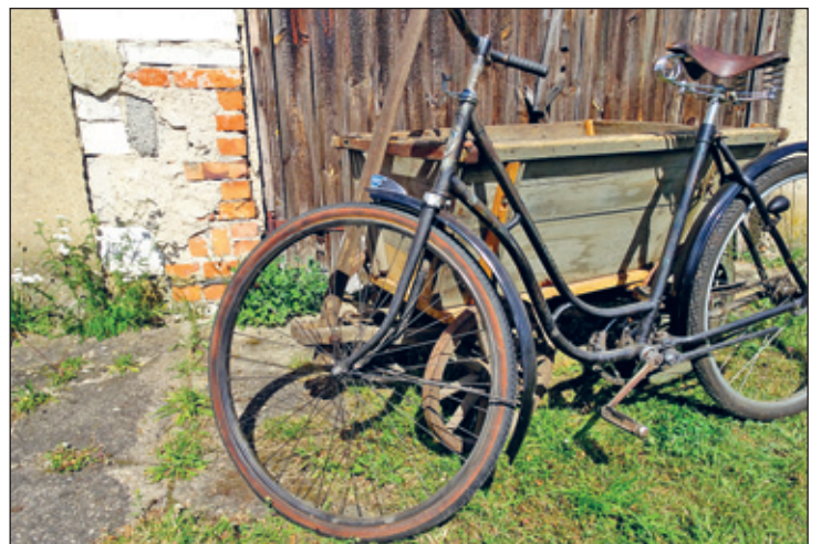
Mit Fahrrad und Leiterwagen