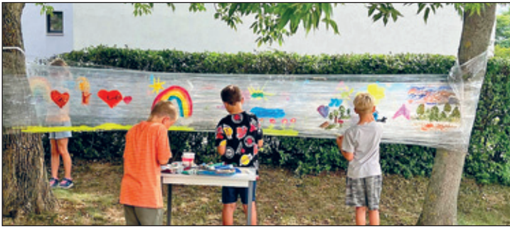
Aktivitäten im Sommer

Wichtig ist es hierbei zu erwähnen, dass die Teilnahme der Besucher im Treff nicht erzwungen wird. Die (Nicht-)Teilnahme eines jungen Menschen an den Aktivitäten basiert auf dem freien Willen, denn jeder wählt, was ihm gefällt und am besten zu ihm passt.