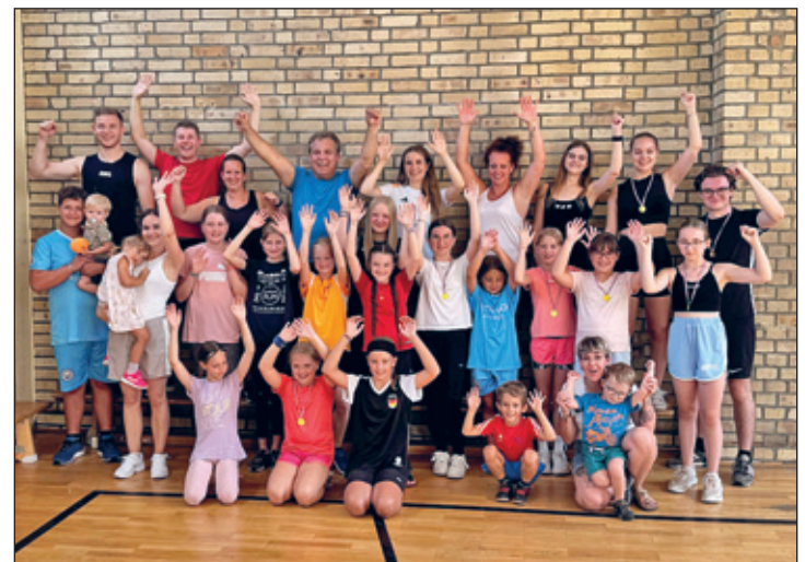
Ein Teil der Olympionikinnen und Olympioniken der Vereinsolympiade des KVK

In geselliger Runde endete schließlich ein ereignisreicher Tag, der Lust auf neue Höhepunkte ab November gemacht hat.