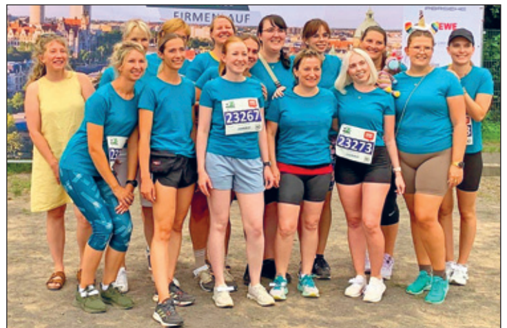
Das Kollegium der Grundschule war beim Firmenlauf in Leipzig am Start